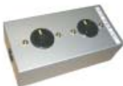
NEMA L6-30 2ヶ口タップ

●記載内容は予告無く変更する事がありますのでご了承下さい。UPSS01SB0505