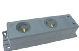
NEMA L6-30 2ヶ口タップ