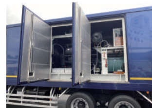
騒音対策用の扉で囲っています

電源車も特殊防音加工を施した車両の用意もございます。 住宅街または夜間の作業で使用したいけど、音が大きいのはちょっと…等、このような現場でも安心してご利用可能です。